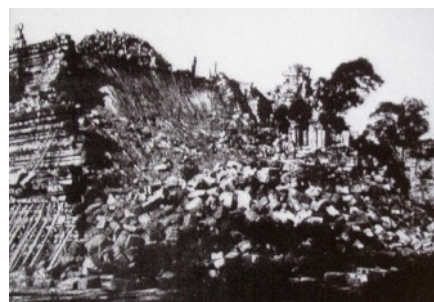
Eboulement de 1943