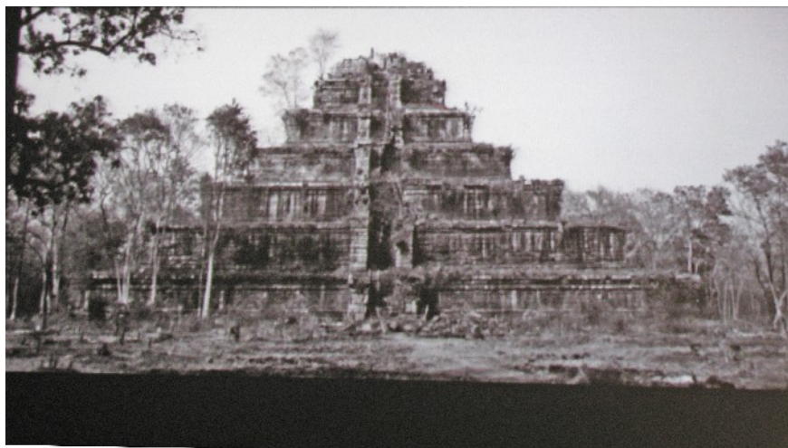
Façade avant l'éboulement

Cette conférence se propose d'en retracer les principaux points grâce à quelques exemples significatifs rencontrés sur ce monument.